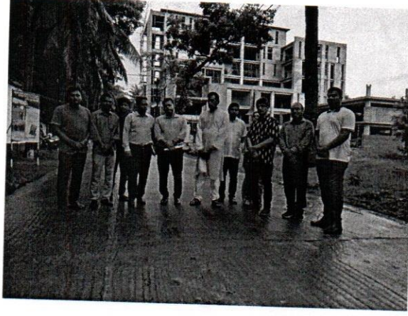
চিত্র: সামুদ্রিক মৎস্য গবেষণা ও প্রযুক্তি কেন্দ্র, কক্সবাজার এর দাপ্তরিক গবেষণা কার্যক্রম পরিদর্শন

জাতীয় শুদ্ধাচার কৌশল কর্মপরিকল্পনা বাস্তবায়নের অংশ হিসেবে বিগত ১৭-১৯ জুন ২০২২ইং তারিখে সামুদ্রিক মৎস্য গবেষণা ও প্রযুক্তি কেন্দ্র, কক্সবাজার পরিদর্শন করা হয়। এ সময় কেন্দ্রে স্থাপিত হ্যাচারীতে উৎপাদিত মাছের পোনা, সামুদ্রিক মাছের গবেষণা কার্যক্রম, কেন্দ্রের ভৌত অবকাঠামো, চলমান উন্নয়ন প্রকল্পের আওতায় নির্মিতব্য স্থাপনা ও অবকাঠামো ইত্যাদি পরিদর্শন করা হয়।