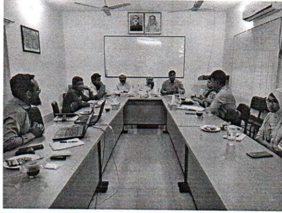
চিত্র: সৈয়দপুরস্থ স্বাদুপানি উপকেন্দ্রের গবেষণা কার্যক্রম পরিদর্শন ও মনিটরিং

জাতীয় শুদ্ধাচার কৌশল কর্মপরিকল্পনা বাস্তবায়নের অংশ হিসেবে বিগত ২০ মার্চ ২০২২ইং তারিখে স্বাদুপানি উপকেন্দ্র, সৈয়দপুর পরিদর্শন করা হয়। এ সময় উপকেন্দ্রে স্থাপিত দেশীয় মাছের লাইভ জীন ব্যাংক পরিদর্শন, হ্যাচারীতে উৎপাদিত মাছের পোনা, বিলুপ্তপ্রায় মাছের গবেষণা কার্যক্রম, উপকেন্দ্রের ভৌত অবকাঠামো ইত্যাদি পরিদর্শন করা হয়। উপকেন্দ্রে স্থাপিত লাইভ জীন ব্যাংকটি প্রকৃতিতে বিলুপ্তপ্রায় মাছের পোনা উৎপাদনে ব্যবহার করা যাবে। উল্লেখ্য, এ জীন ব্যাংকে দেশের বিভিন্ন অঞ্চল থেকে দেশীয় মাছ সংরক্ষণ করা হবে; যা ময়মনসিংহস্থ স্বাদুপানি কেন্দ্রে স্থাপিত লাইভ জীন ব্যাংকের রেপ্লিকা হিসেবে কাজ করবে। ফলে ময়মনসিংহে স্থাপিত জীন ব্যাংকে কোনো ধরনের বিপর্যয় ঘটলেও মাছগুলো আর হারিয়ে যাবে না।