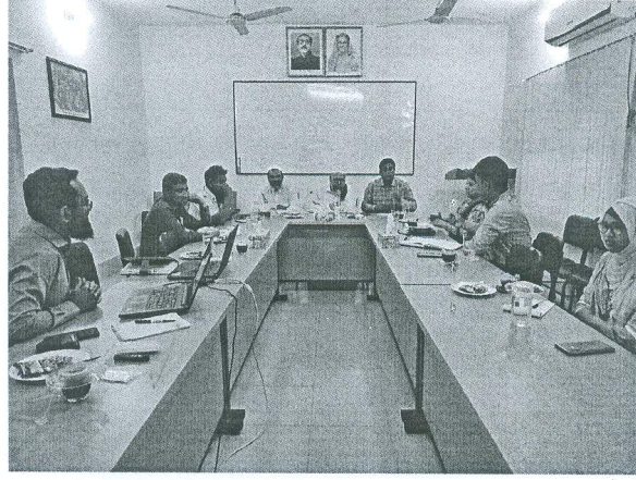
চিত্র: সৈয়দপুরস্থ স্বাদুপানি উপকেন্দ্রের গবেষণা কার্যক্রম পরিদর্শন ও মনিটরিং

জাতীয় শুদ্ধাচার কৌশল কর্মপরিকল্পনা বাস্তবায়নের অংশ হিসেবে বিগত ২০ মার্চ ২০২২ইং তারিখে স্বাদুপানি উপকেন্দ্র, সৈয়দপুর পরিদর্শন করা হয়। এ সময় উপকেন্দ্রে স্থাপিত দেশীয় মাছের লাইভ জীন ব্যাংক পরিদর্শন, হ্যাচারীতে উৎপাদিত মাছের পোনা, বিলুপ্তপ্রায় মাছের গবেষণা কার্যক্রম, উপকেন্দ্রের ভৌত অবকাঠামো ইত্যাদি পরিদর্শন করা হয়। উপকেন্দ্রে স্থাপিত লাইভ জীন ব্যাংকটি প্রকৃতিতে বিলুপ্তপ্রায় মাছের পোনা উৎপাদনে ব্যবহার করা যাবে। উল্লেখ্য, এ জীন ব্যাংকে দেশের বিভিন্ন অঞ্চল থেকে দেশীয় মাছ সংরক্ষণ করা হবে; যা ময়মনসিংহস্থ স্বাদুপানি কেন্দ্রে স্থাপিত লাইভ জীন ব্যাংকের রেপ্লিকা হিসেবে কাজ করবে। ফলে ময়মনসিংহে স্থাপিত জীন ব্যাংকে কোনো ধরনের বিপর্যয় ঘটলেও মাছগুলো আর হারিয়ে যাবে না।