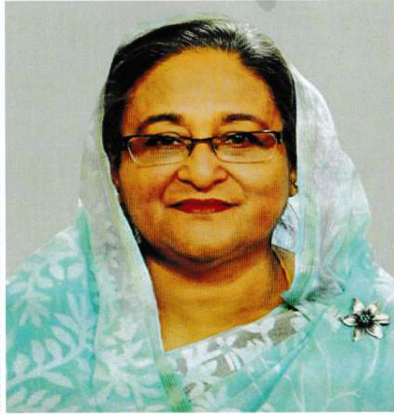
শেখ হাসিনা মাননীয় প্রধানমন্ত্রী গণপ্রজাতন্ত্রী বাংলাদেশ সরকার