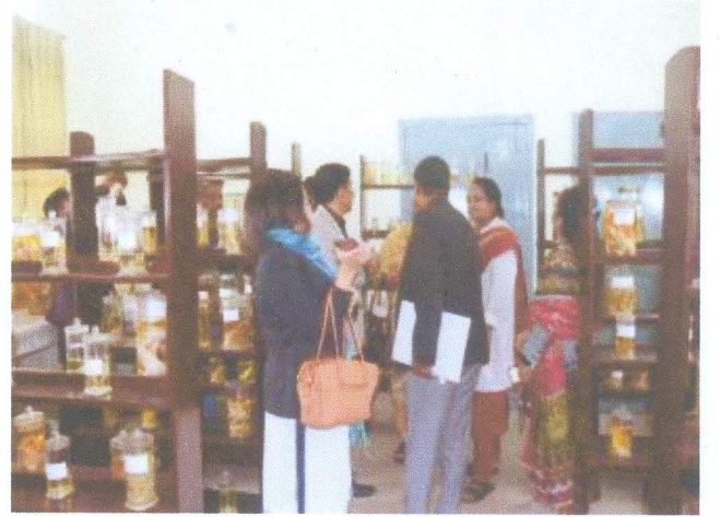
চিত্রঃ নদী কেন্দ্র, চাঁদপুর এর আর্থিক ও গবেষণা কার্যক্রম পরিবীক্ষণ