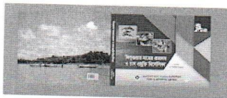
Cover Page- Book.png 8940K