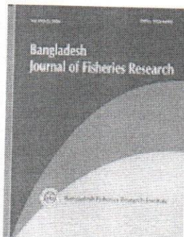
Cover Page of BJFR 19 (1-2) 2020.jpg 1553K