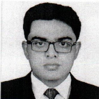
3 RIZVI.jpg 50K