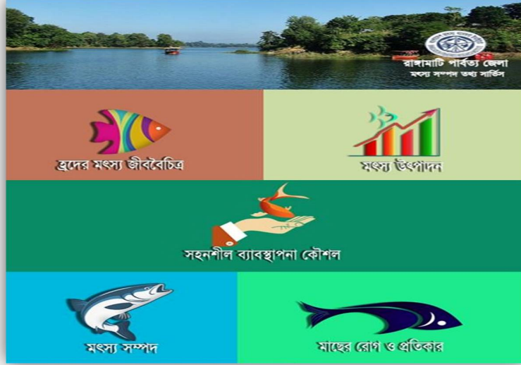
ছবি: BFRI in Captai Lake Info মোবাইল এ্যাপস

বাংলাদেশ মৎস্য গবেষণা ইনস্টিটিউট (বিএফআরআই) কর্তৃক কাপ্তাই লেকে গবেষণালব্ধ ফলাফল জনসাধারণকে অবহতি করার জন্য নিজস্ব অর্থায়নে "BFRI in Captai Lake Info" নামে একটি মোবাইল এ্যাপস তৈরী করা হয়েছে। বর্তমানে এ্যাপসটি টেস্ট ভিত্তিতে ব্যবহার করা হচ্ছে।