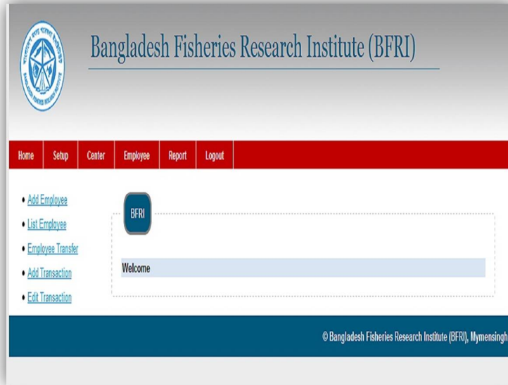
ছবি: সিপিএফ হিসাব সহজীকরণ সফটওয়্যার

ইনস্টিটিউটের সদরদপ্তরসহ সকল কেন্দ্র ও উপকেন্দ্রে কর্মরত কর্মকর্তা/কর্মচারীর সিপিএফ হিসাব সহজীকরণের জন্য নিজস্ব অর্থায়নে একটি সফটওয়্যার তৈরী করা হয়েছে। বর্তমানে সফটওয়্যারটি টেস্ট ভিত্তিতে ব্যবহার করা হচ্ছে।