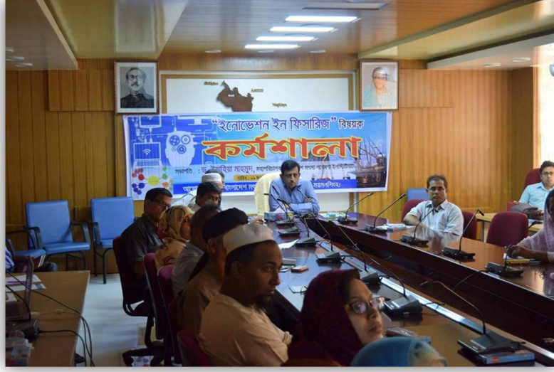
ছবি: ইনোভেশন ইন ফিশারিজ বিষয়ক কর্মশালা